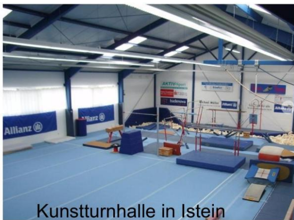
Kunstturnhalle in Istein