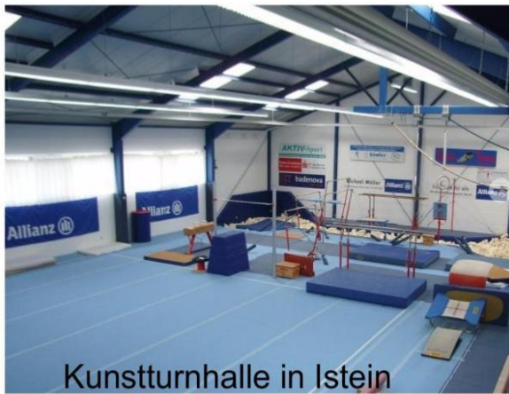
Kunstturnhalle in Istein