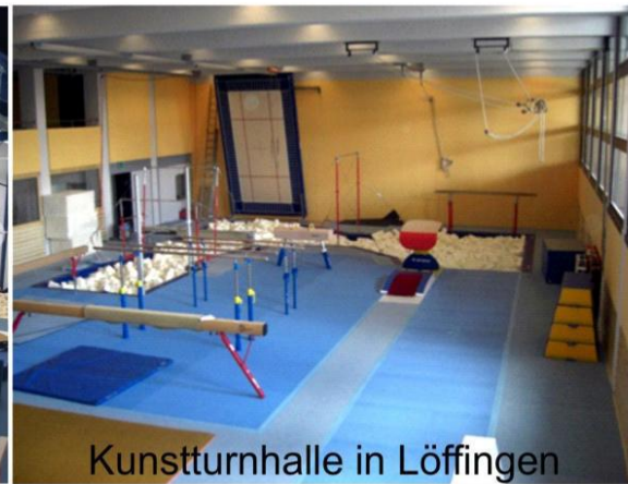
Kunstturnhalle in Löffingen

Freizeit- u. Wettkampfbekleidung Turn- u. Kunstturnhallenbau Turnhallen und Sportplatzgeräte Inspektionen und Wartung