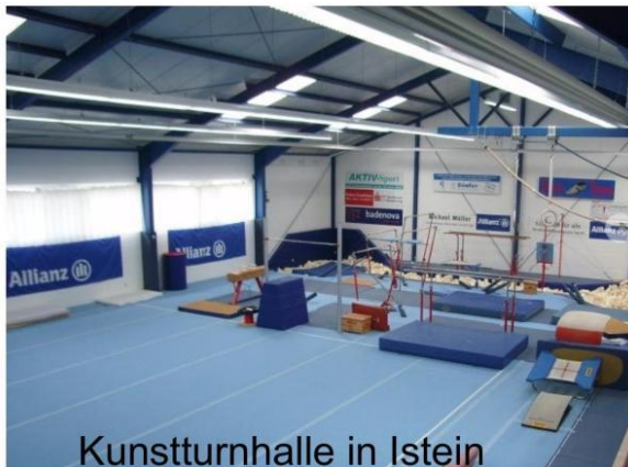
Kunstturnhalle in Istein