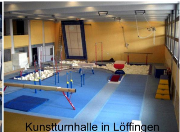
Kunstturnhalle in Löffingen

Freizeit- u. Wettkampfbekleidung Turn- u. Kunstturnhallenbau Turnhallen und Sportplatzgeräte Inspektionen und Wartung